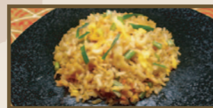
スタミナ具材たっぷり 炒め卵キムチ炒飯 440 円