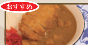
おすすめ サクッと揚げた カツカレー 550 円