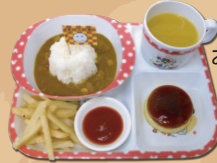
お子様ランチ A お子様カレー 440 円