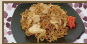
おたふくソースが決め手 焼きそば 380 円