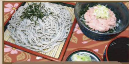
もりそば (うどん) ミニネギトロ丼セット