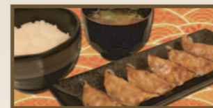
パリッとジューシー 餃子定食 490 円