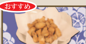
おすすめ 歯ごたえ最高 軟骨のから揚げ 330 円