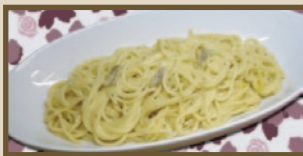
まるやかクリーミー カルボナーラ 440 円