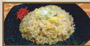
パラッとふっくら あおり炒め炒飯 440 円