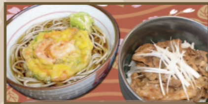
天そば (うどん) ミニカルビ丼セット