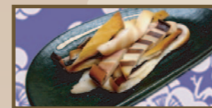
旨味凝縮 漁火焼イカ 330 円