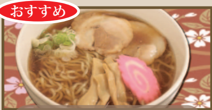
味噌ラーメン 醤油ラーメン 塩ラーメン