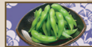
ビールのお供に 枝豆 220 円