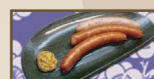
3種類の味が楽しめる ソーセージ 330 円