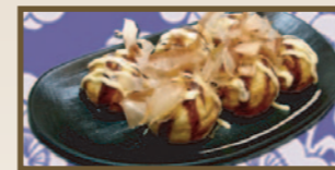
大だこ入り!! たこ焼き (6粒) 380 円