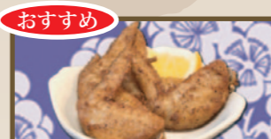
おすすめ 粒胡椒が効いた 手羽先揚げ (4本) 330 円