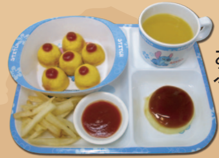
お子様ランチ B ぷちオムライス 440 円

ぷちオムライス・フライドポテト・プリン オレンジジュース or アップルジュース