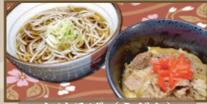
かけそば (うどん) ミニ牛丼セット