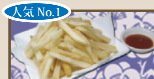
人気 No.1 盛り盛り フライドポテト 330 円