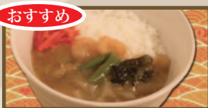
とうとあんかけ 中華丼 490 円