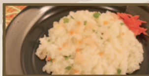
ぷりぷりエビが旨い エビピラフ 440 円