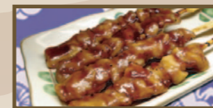
甘だれやわらか 焼鳥 (4本) 330 円