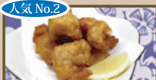
人気 No.2 ふんわりジューシー 若鶏の唐揚げ 380 円