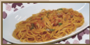
昔懐かしい ナポリタン 440 円