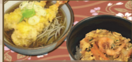
海老天そば (うどん) ミニかき揚げ丼