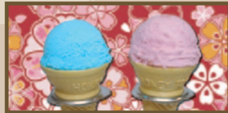
アイスクリーム 各160円