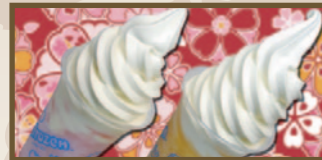
ソフトローズンソフト 各260円