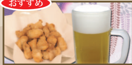
おすすめ 軟骨のから揚げセット 610円