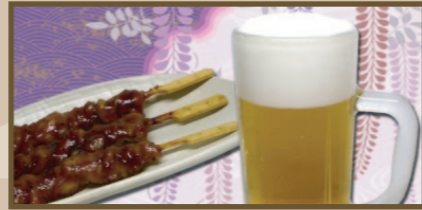
焼鳥セット (3本) 610円