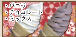
ソフトクリーム 各260円