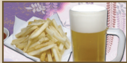
フライドポテトセット 610円