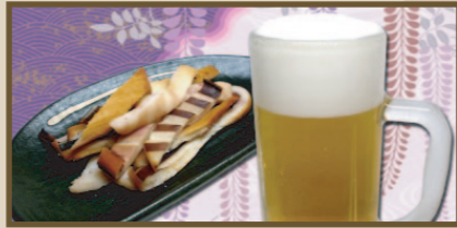
漁火焼イカセット 610円