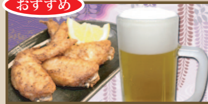
おすすめ 手羽先揚げセット (3本) 610円